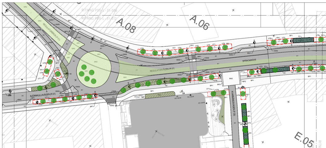
Figur 1, illustration över nya cirkulationsplatsen och nya Regulatorvägen

Korsningen föreslås byggas om från en nuvarande T-korsning till en cirkulationsplats, se figur 1 nedan. Gatusektionen breddas från brofästet och in på Regulatorvägen, där plats möjliggörs för eventuell förlängning av Spårväg syd ner i Flemingsbergsdalen. Vidare är slutprodukten en stadsgata likt en boulevard med breda separerade gång- och cykelstråk, trädplanteringar och ytor för omhändertagande av dagvatten. Den nya trafiklösningen med cirkulation kommer att ge ett jämnare flöde för bil- och busstrafik genom korsningen. Planerad trafiklösning och utformning av platsen är framtagen för att möta målen för Flemingsbergsdalen om att utvecklas från verksamhetsområde till regional stadskärna på ett hållbart och genomförbart sätt.